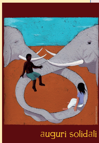
auguri solidali Biglietto A