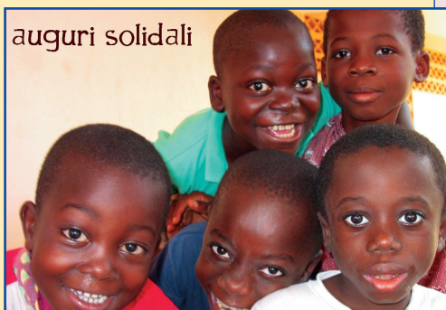
auguri solidali Biglietto C