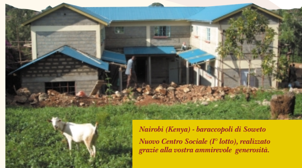
Nairobi (Kenya) - baraccopoli di Soweto Nuovo Centro Sociale (1° lotto), realizzato grazie alla vostra ammirevole generosità.